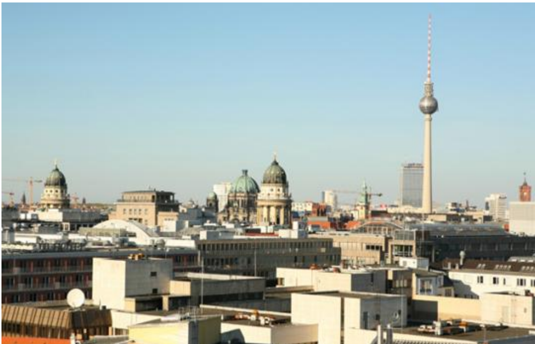
Blick von der Dachterrasse der Hochzeitslocation