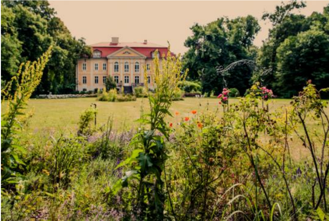
Schloss in Brandenburg für romantische Hochzeitsfeier

Sie haben eine Hochzeitslocation in Berlin, Hamburg oder München? Ihnen gehört ein idyllisches Gutshaus oder ein romantisches Schlosshotel in Mecklenburg-Vorpommern, Schleswig-Holstein oder Bayern? Ihnen liebe Schlossbesitzer, Inhaber eines Gutshauses oder Betreiber einer Eventlocation ... bieten wir mit der Präsentation Ihrer Hochzeitslocation auf unserer Website die Möglichkeit, Ihr Haus allen Heiratswilligen vorzustellen.